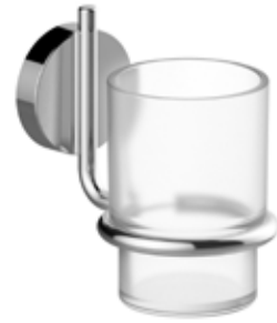
■ A200100CR cm L. 7,6 x H. 11,2 x P. 11,5