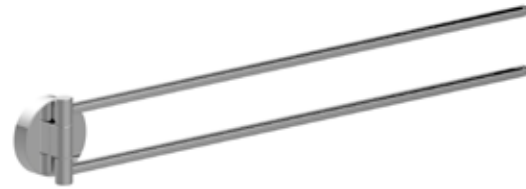
■ A200150CR cm L. 43,2 x H. 6 x P. 2,7