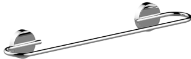
■ A20090ACR cm L. 30 x H. 5,4 x P. 7,7 ■ A20090BCR cm L. 45 x H. 5,4 x P. 7,7 ■ A20090CCR cm L. 60 x H. 5,4 x P. 7,7