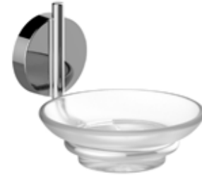
■ A200110CR cm L. 10,9 x H. 9,5 x P. 13,3