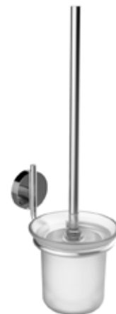
■ A200140CR cm L. 11,5 x H. 38 x P. 15,5