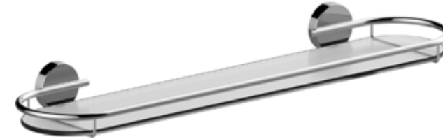
■ A200090CR cm L. 60,8 x H. 5,6 x P. 14,4