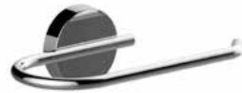
■ A200250CR cm L. 17 x H. 5,4 x P. 8,7