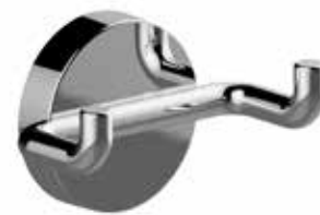
■ A200210CR cm L. 8,4 x H. 5,4 x P. 5,1